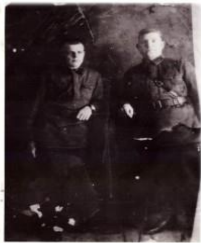
Война застала его 19-летним в Смоленске

Очень жаль, что прадед не дожил до наших дней, но память о Великой Отечественной войне будет жить вечно в сердцах людей.